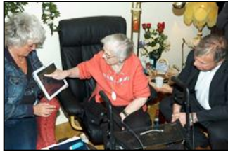
Brukere: Hjemmeboende pleietrengende