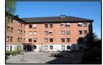
1. linje: Sykehjem