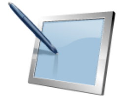
2. linje: Sykehus